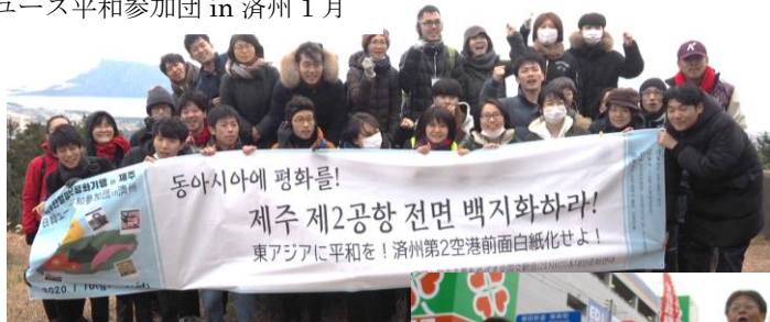
日韓ユース平和参加団 in 済州 1月

よびかけ 平和と民主主義を ともにつくる会・大阪 大阪市城東区関目 6-4-2-103 山川よしやす事務所 TEL 06-6936-3073 HP 「山川よしやす」で検索