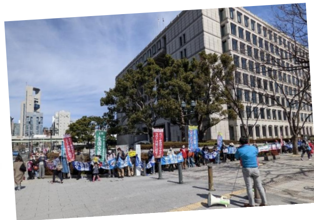
広域一元化反対大阪市役所ヒューマンチェーンと城東区デモ